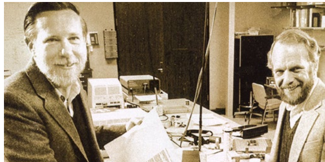
Adobe-Mitbegründer John Warnock und Chuck Geschke

Fast jeder Computer, jedes mobile Gerät und jeder Drucker ist heute in der Lage, PDF-Dokumente zu erstellen, zu bearbeiten, anzuzeigen oder auszugeben. PDF ist der De-facto-Standard für elektronische Dokumente weltweit. Keine andere Technologie kommt an seine Akzeptanz im Markt heran.